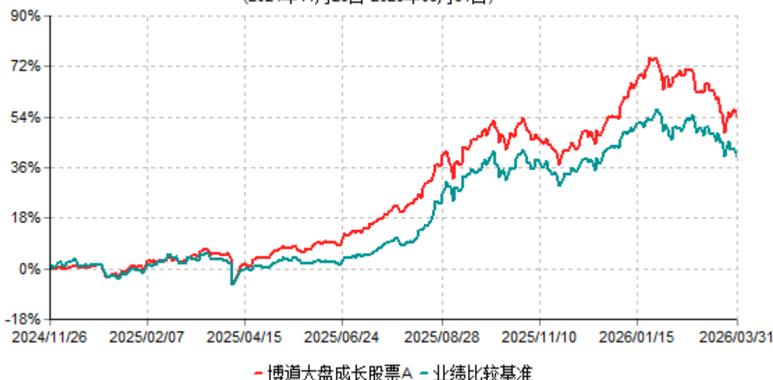
博道大盘成长股票A累计净值增长率与业绩比较基准收益率历史走势对比图 (2024年11月26日-2026年03月31日)

注：本基金基金合同生效日为2024年11月26日，建仓期为自基金合同生效日起的6个月。截至报告期期末，本基金已完成建仓但报告期期末距建仓结束未满一年。截至建仓期结束，本基金各项资产配置比例符合基金合同及招募说明书有关投资比例的约定。