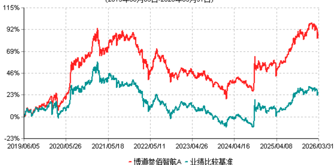
博道叁佰智航A累计净值增长率与业绩比较基准收益率历史走势对比图 (2019年06月05日-2026年03月31日)

注：本基金建仓期为自基金合同生效日起的6个月。截至建仓期结束，本基金各项资产配置比例符合基金合同及招募说明书有关投资比例的约定。