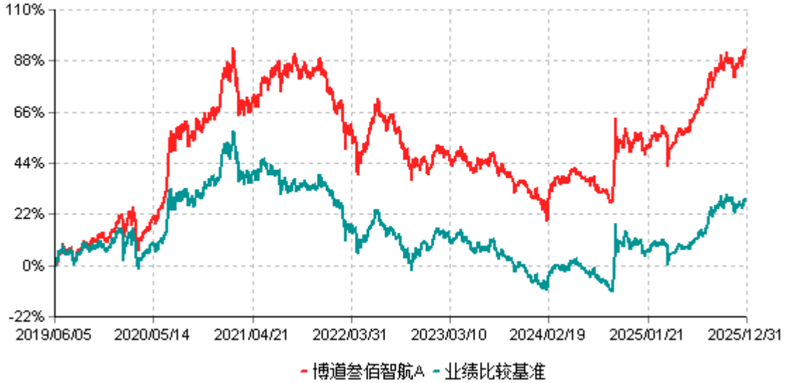
博道叁佰智航A累计净值增长率与业绩比较基准收益率历史走势对比图 (2019年06月05日-2025年12月31日)

注：本基金建仓期为自基金合同生效日起的6个月。截至建仓期结束，本基金各项资产配置比例符合基金合同及招募说明书有关投资比例的约定。