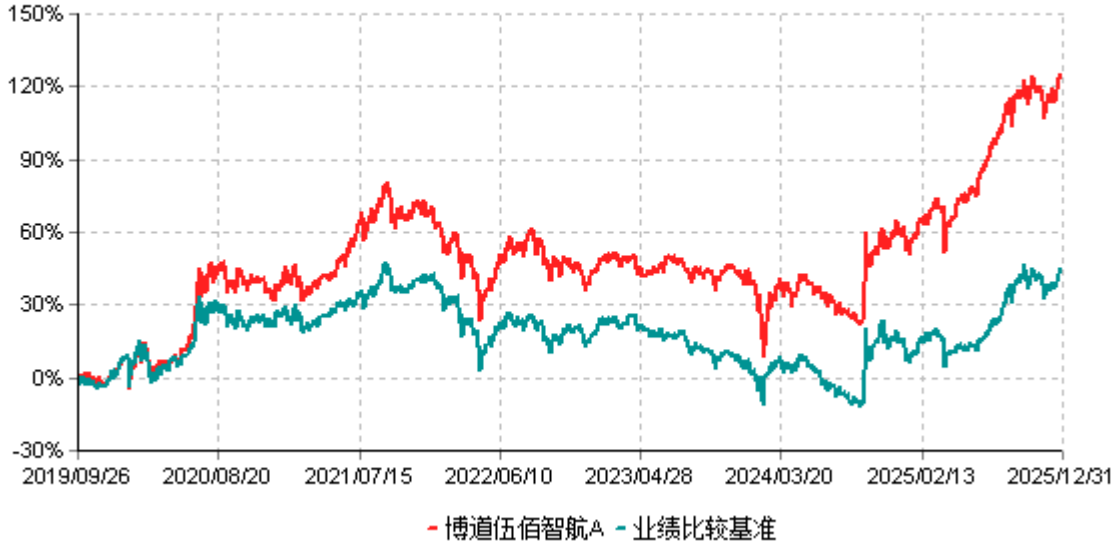
博道伍佰智航A累计净值增长率与业绩比较基准收益率历史走势对比图 (2019年09月26日-2025年12月31日)

注：本基金建仓期为自基金合同生效日起的6个月。截至建仓期结束，本基金各项资产配置比例符合基金合同及招募说明书有关投资比例的约定。