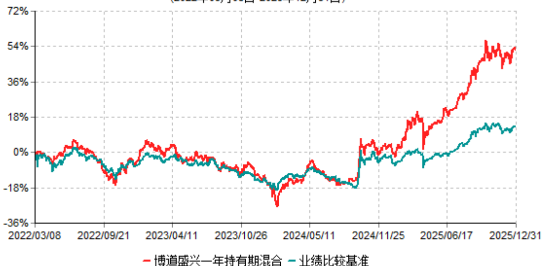
博道盛兴一年持有期混合累计净值增长率与业绩比较基准收益率历史走势对比图 (2022年03月08日-2025年12月31日)

注：本基金建仓期为自基金合同生效日起的6个月。截至建仓期结束，本基金各项资产配置比例符合基金合同及招募说明书有关投资比例的约定。