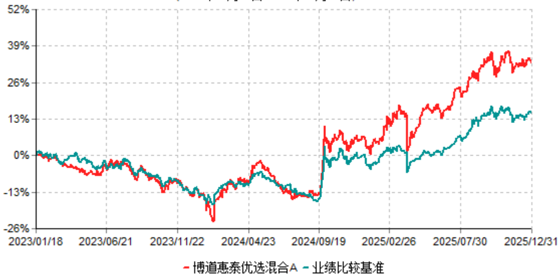
博道惠泰优选混合A累计净值增长率与业绩比较基准收益率历史走势对比图 (2023年01月18日-2025年12月31日)

注：本基金建仓期为自基金合同生效日起的6个月。截至建仓期结束，本基金各项资产配置比例符合基金合同及招募说明书有关投资比例的约定。