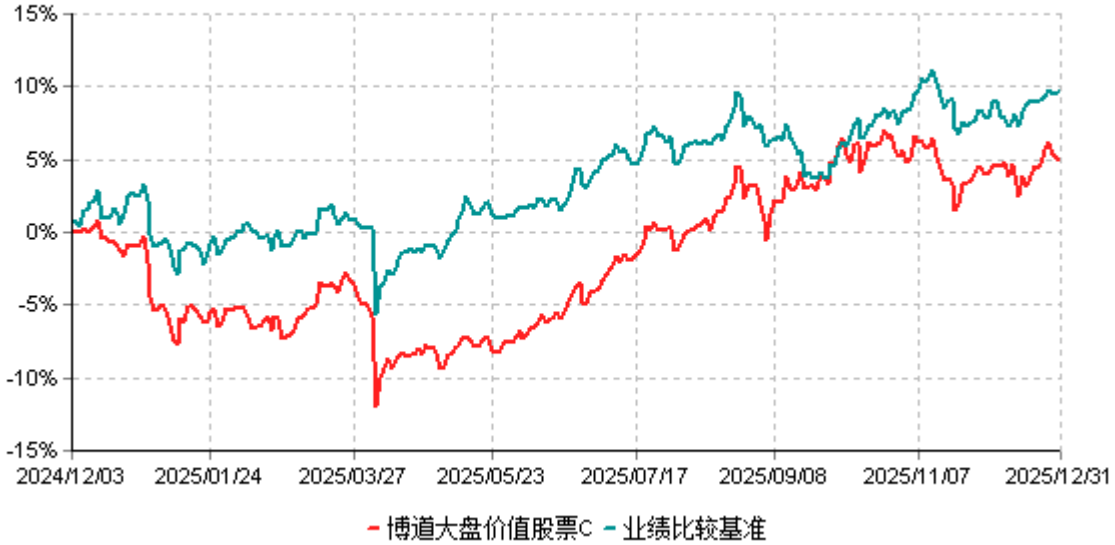
博道大盘价值股票C累计净值增长率与业绩比较基准收益率历史走势对比图 (2024年12月03日-2025年12月31日)

注：本基金基金合同生效日为2024年12月3日，建仓期为自基金合同生效日起的6个月。截至报告期期末，本基金已完成建仓但报告期期末距建仓结束未满一年。截至建仓期结束，本基金各项资产配置比例符合基金合同及招募说明书有关投资比例的约定。