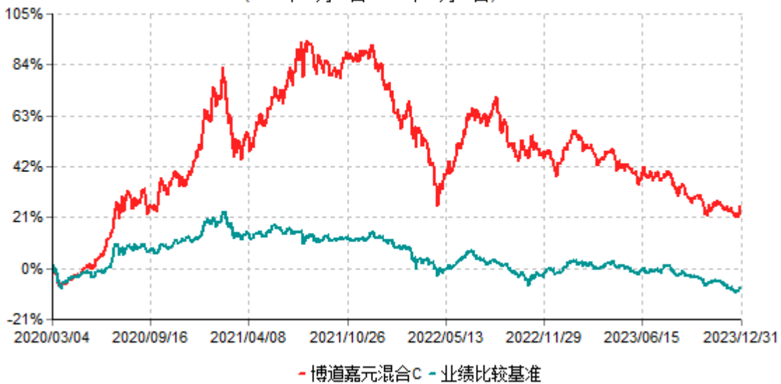
博道嘉元混合C累计净值增长率与业绩比较基准收益率历史走势对比图 (2020年03月04日-2023年12月31日)

注：本基金建仓期为自基金合同生效日起的6个月。截至建仓期结束，本基金各项资产配置比例符合基金合同及招募说明书有关投资比例的约定。