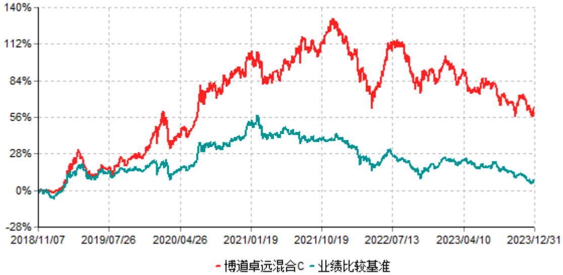
博道卓远混合C累计净值增长率与业绩比较基准收益率历史走势对比图 (2018年11月07日-2023年12月31日)

注：本基金建仓期为自基金合同生效日起的6个月。截至建仓期结束，本基金各项资产配置比例符合基金合同及招募说明书有关投资比例的约定。