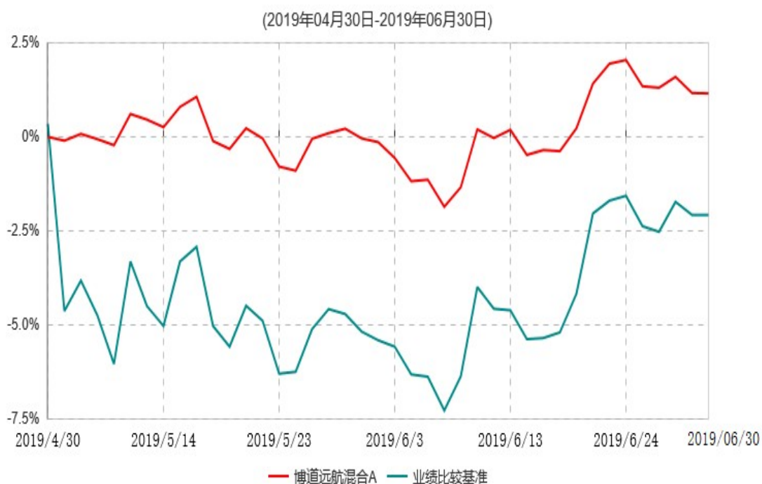
博道远航混合A累计净值增长率与业绩比较基准收益率历史走势对比图

注：本基金基金合同生效日为2019年4月30日，基金合同生效日至报告期期末，本基金运作时间未满一年。本基金建仓期为自基金合同生效日起的6个月。截至2019年6月30日，本基金尚处于建仓期。