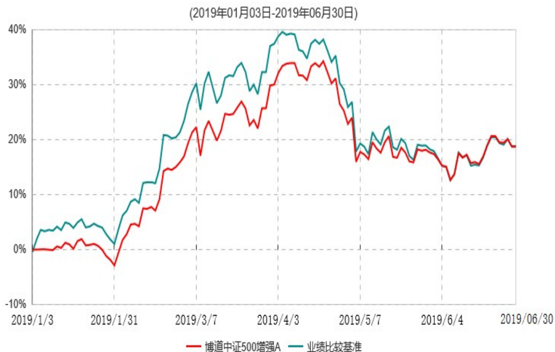
博道中证500增强A累计净值增长率与业绩比较基准收益率历史走势对比图

注：本基金基金合同生效日为 2019 年 1 月 3 日，基金合同生效日至报告期期末，本基金运作时间未满一年。本基金建仓期为自基金合同生效日起的 6 个月。截至 2019 年 6 月 30 日，本基金尚处于建仓期。